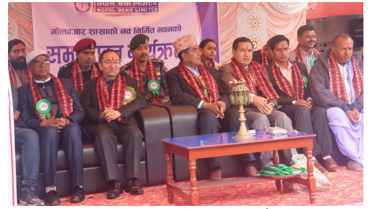
अनुरुप निर्माण भएको यस भवनबाट शाखा, ५९ एक्सटेन्सन काउन्टर र २०४ ग्राहकहरूले सम्पूर्ण बैंकिङ सुविधा एटिएम काउन्टरमार्फत सेवा दिँदै प्राप्त गर्न सक्नेछन्। हाल बैंकले २२९ आएको छ।

नेपालको पहिलो बैंक समेत रहेको यस बैंकले देशका विभिन्न स्थानमा रहेको आफ्नो जग्गामा आवश्यकताको आधारमा भवन निर्माण गरी कारोबार सञ्चालन गर्ने नीति