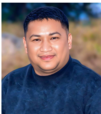
महत्वपूर्ण छ ।

यही प्रश्नले अर्को महत्वपूर्ण बहस जन्माएको छ । नेपाली पत्रकारिताको इतिहास, संघर्ष र विचार निर्माणको यात्रामा साप्ताहिक पत्रिकाहरूको भूमिका अत्यन्त महत्वपूर्ण रहँदै आएको छ । सीमित स्रोतसाधनका बीच सम्पादक र प्रकाशकले व्यक्तिगत त्याग गरेर सञ्चालन गरेका यस्ता प्रकाशनहरू आज पनि वैचारिक बहस र जनमत निर्माणमा सक्रिय छन् । त्यसैले प्रेस स्वतन्त्रताको बहसमा उनीहरूको अस्तित्व र आर्थिक स्थायित्वको प्रश्न पनि उत्तिकै